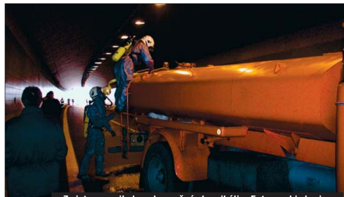
Z cisterny unikala nebezpečná chemikálie.

Tunel na jihlavském obchvatu je španý, 300 metrů dlouhý. Přísná bezpečnostní opatření v něm mají zabránit tragickým následkům dopravních nehod.